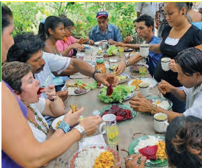
Alle an einem Tisch – auch in Costa Rica