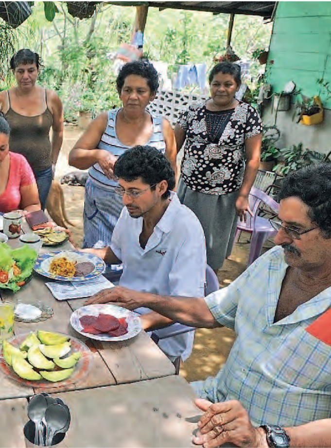
Üblich: das Tischgebet vor dem Essen in Costa Rica

Christinnen und Christen weltweit verbindet, sucht die Kampagne nach Möglichkeiten, wie dieses Miteinander von Verbraucherinnen und Verbrauchern einerseits und kleinbäuerlichen Produzenten andererseits gestaltet und entwickelt werden kann – gerade angesichts der bestehenden „herrschenden“ Unterschiede.